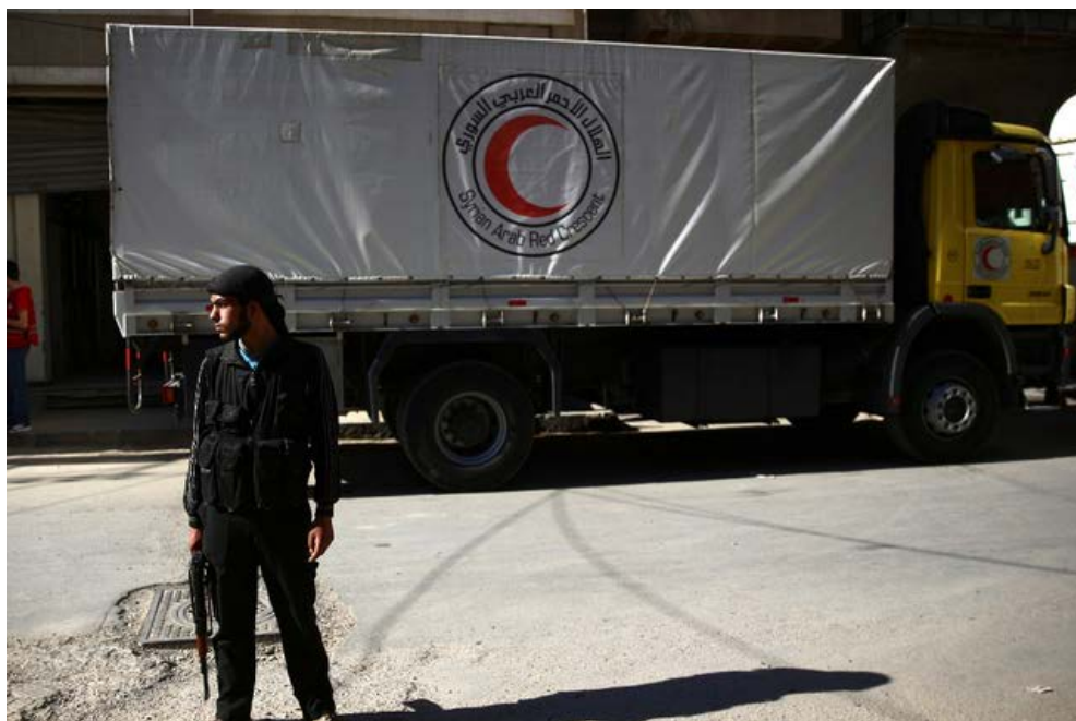
Ce combattant syrien, placé devant un véhicule de la Fédération de la Croix-Rouge et des Croissants rouges, utilisera peut-être l'application lancée ce 19 mai 2015 par l'Appel de Genève.

Droit humanitaire L'Appel de Genève a lancé mardi une initiative originale. L'ONG veut faire connaître le droit humanitaire grâce à une application mobile «Combattant, pas assassin».