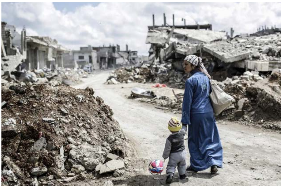
Selon des données récentes, 40% de la population mondiale vit dans un pays qui connaît un conflit interne. Sur la photo, Kobané en Syrie.

Genève internationale Pour les fondateurs de TRIAL et de l'Appel de Genève, l'engagement pour la paix et le respect du droit est un combat de tous les instants