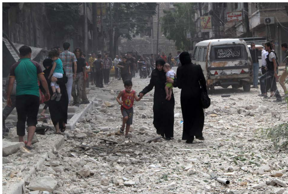
1/150 | Un groupe armé actif dans les zones kurdes en Syrie s'est engagé à ne pas

Des forces militaires majeures se sont engagées à ne pas utiliser les mines antipersonnel et à commettre des violences sexuelles dans les zones kurdes en Syrie.