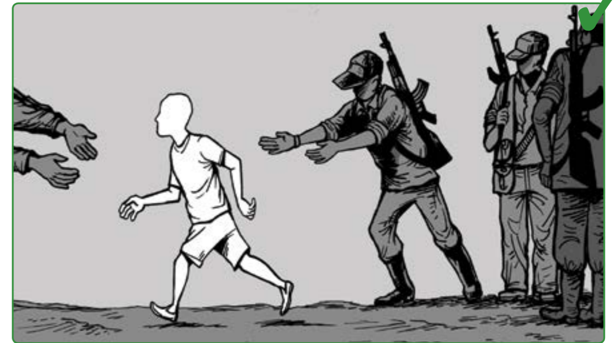
7 کانى که مندالان له هېزه چەكدارى پڼوه چيا ده به وه، ده بى نه م کاره بى هېچ مه ترسيه گ نه تاجم بدرت