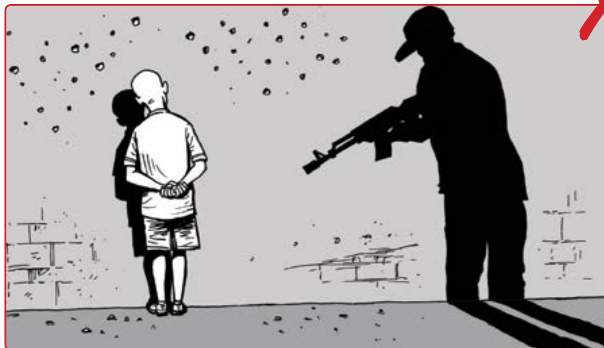
6 هەرگيز نابى مندالان له سیداره بدرين