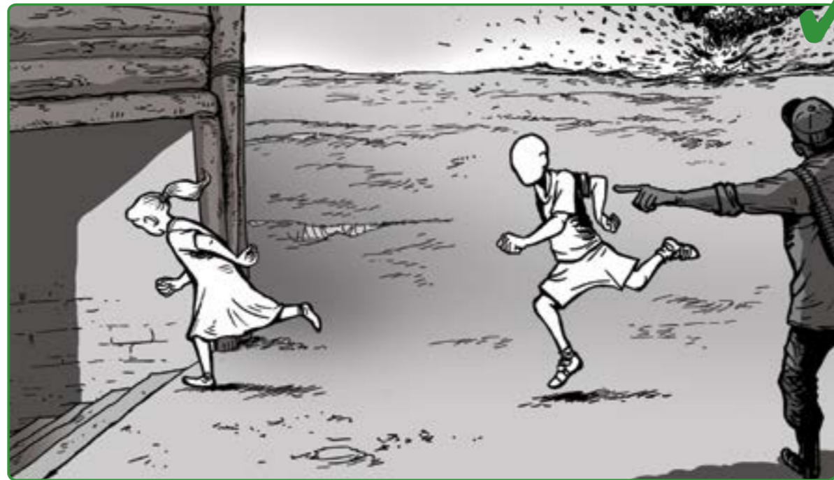
8 ده بى نه وهى هه ول بدرت بۇ نه وهى مندالان له کارگه رى نۇنراسيونه چەكداره کان دور بڼ