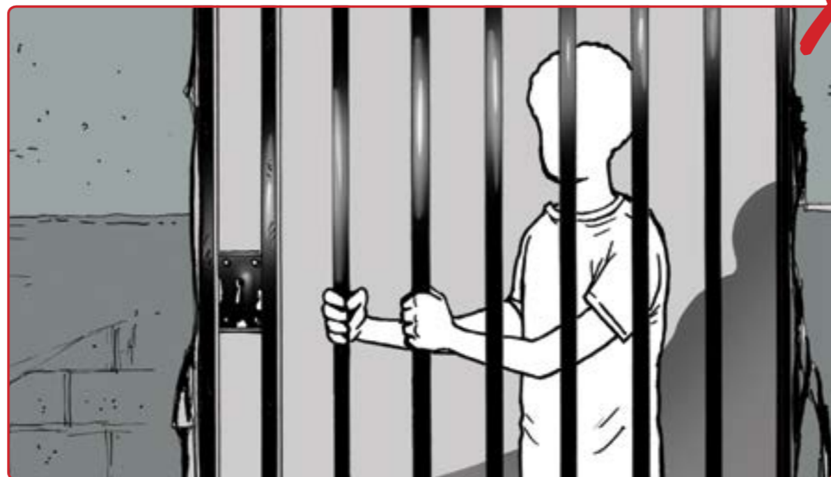
5 ته نهها کاتنگ ده بى مندالان ده سه سه سەر بکرتن که هېچ رنجه چاره يکى تر نه پڼت