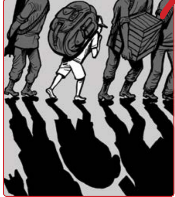
2 نابى مندالان بۇ شەرى بان چالاکيه کانى هاوړنوه ند به شەرى به کار به پڼترن ته تابه نه گەر خو به خشانه به شدارى بگەن