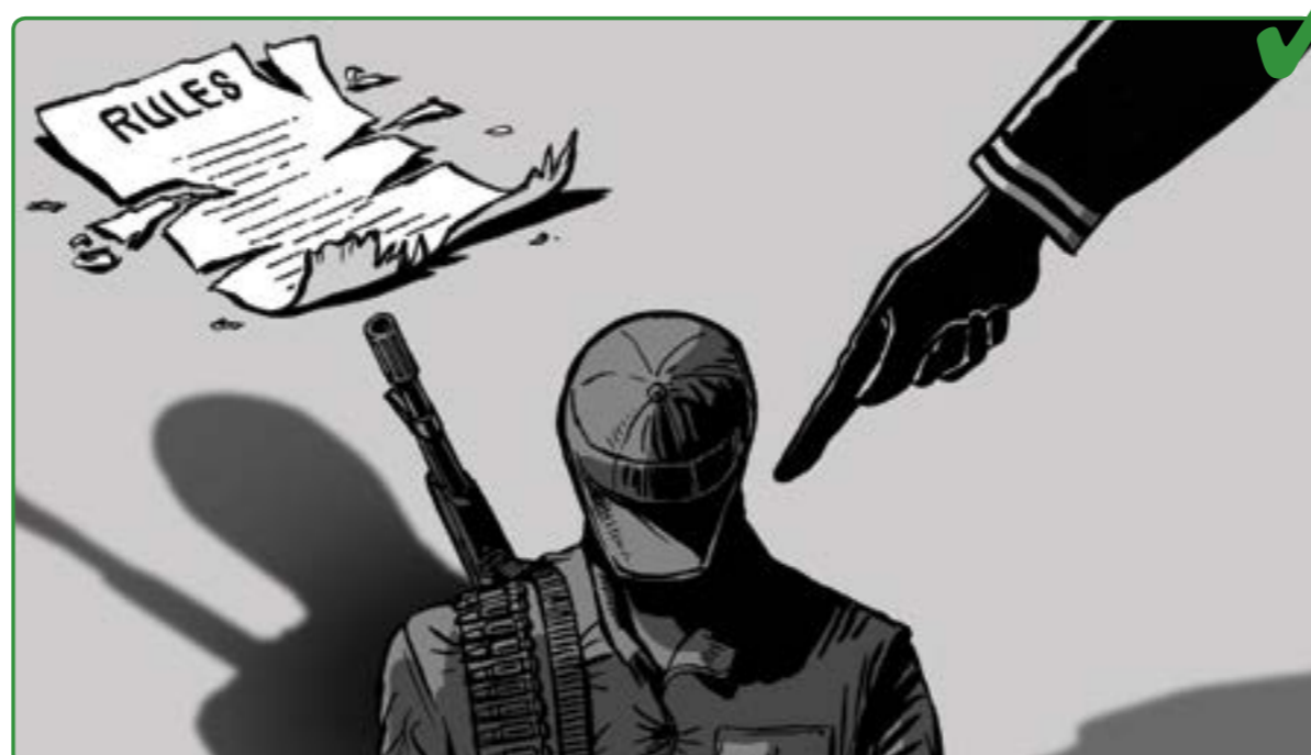
11 ده بى هه چوره بڼکردنى نه م رنسانه به بڼى ستاندارده نونه ته وه يه کان سزا بدرت