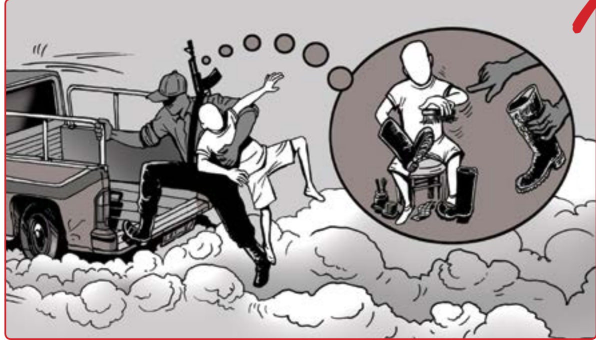
3 به هېچ شتو به يک نابى مندالان بۇ پڼوه ندىکردن به هېزه چەكداره کانه وه بخرتبه زتر گوشار