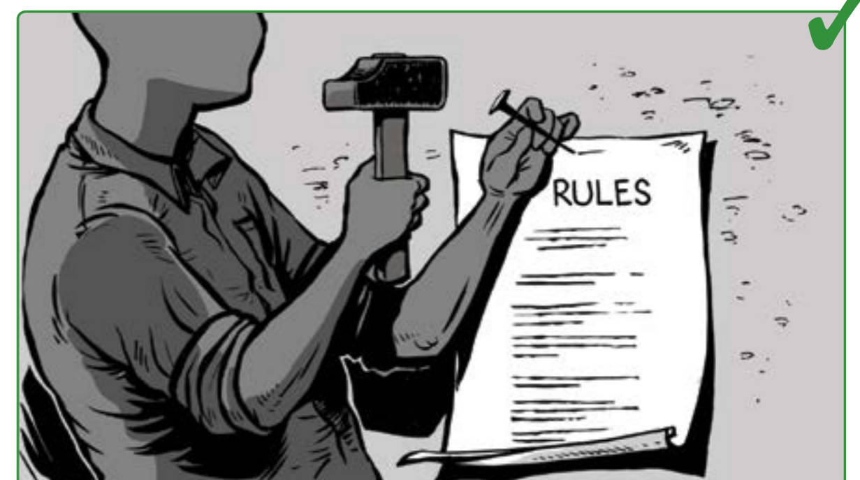
10 ده بى نه م رنسانه چيه جى بگەن