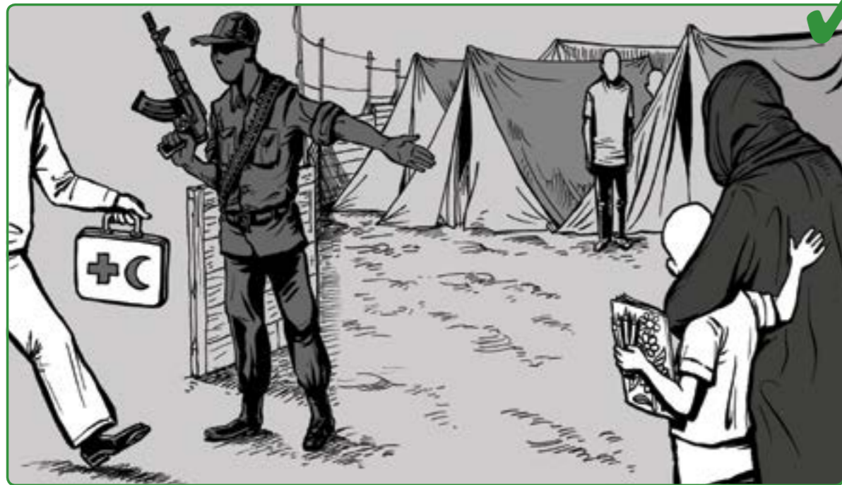
9 پڼوسنه هه موو تواناي خوتان بخرنه گەر بۇ نه وهى دنيا بڼ که يارمه تى و چاودتيرى پڼوسنه بۇ مندالان دابڼ ده کرت