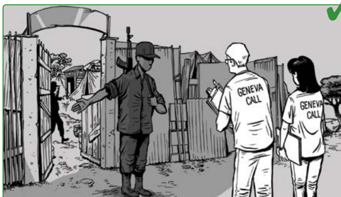
12 له گه ل بانگه وازى ژنىف (Geneva Call) هاوکارى بگەن بۇ چاودتيرى خوتنه تى باه نديون به م رنسانه