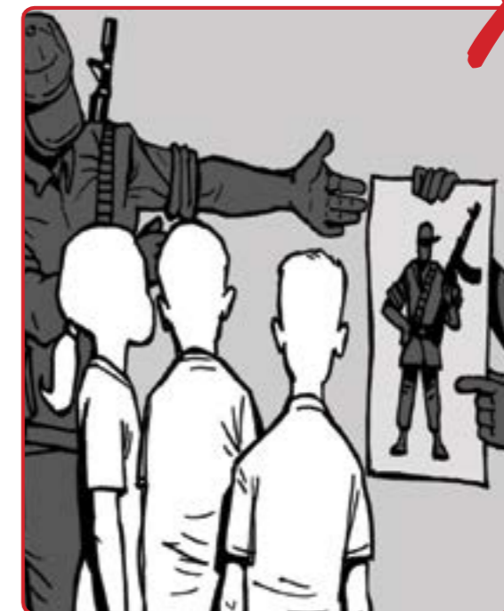
4 نابى مندالان بۇ به نه مندانون له هېزه چەكداره کان دا وه رنگرين بان رنجه بان پڼ بدرت بيه نه تادام ته تابه نه گەر خو به خشانه به شدارى بگەن