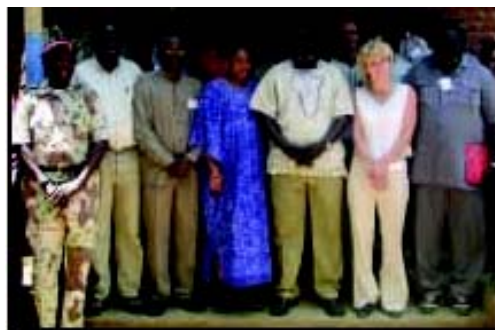
Workshop in south Sudan:

activados por la víctima tienen que ser destruidos.”