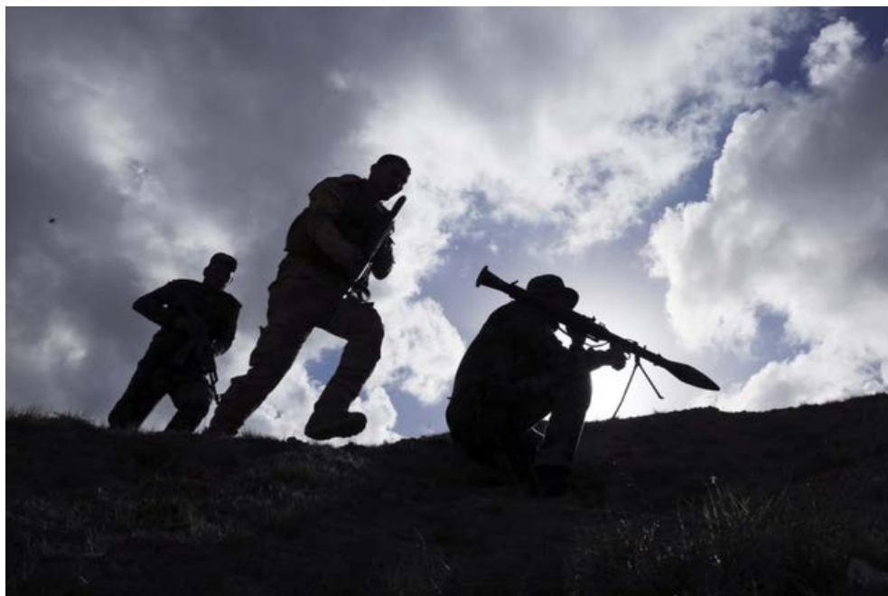
Combattants chiïtes sur le front de Tikrit, en Irak.

Droit humanitaire L'ONG annonce avoir réuni à Bagdad 29 commandants qui font face au groupe Etat islamique (Daech).